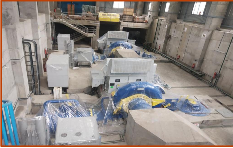
पावर हाउसको मेसिन फ्लोर ।

बाढीले क्षति भएको पावर हाउस क्षेत्रको Machine हरुको मर्मत कार्य सुरु भईसकेको छ साथै नयाँ खरिद गर्नु पर्ने उपकरणहरुको लागि पनि सम्झौता भईसकेको छ । क्षति ग्रस्त उपकरणहरुको बिमाको भुक्तानीको लागि बिमा कम्पनी सँग छलफल भई आवश्यक प्रक्रिया सुरु भईसकेको छ ।