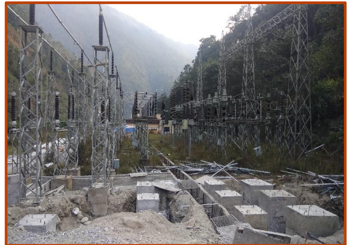
Singati Substation मा Bus Bar को foundation