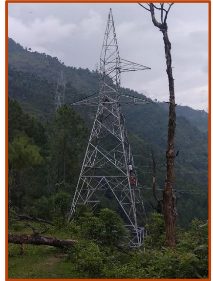
Tower erection को निर्माण कार्य भईरहेको ।

बाढीले क्षति भएको पावर हाउस क्षेत्रको Machine हरुको मर्मत कार्य सुरु भईसकेको छ साथै नयाँ खरिद गर्नु पर्ने उपकरणहरुको लागि पनि सम्झौता भईसकेको छ । क्षति ग्रस्त उपकरणहरुको बिमाको भुक्तानीको लागि बिमा कम्पनी सँग छलफल भई आवश्यक प्रक्रिया सुरु भईसकेको छ ।