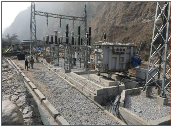
Power House Switch yard को कार्य प्रगति ।

आयोजनाको १३२ के.भी Transmission line को कार्य अर्न्तगत Tower foundation को कार्य सकिसकेको छ भने १५ वटा मध्ये १३ वटा Tower erection को कार्य सम्पन्न भईसकेको छ । त्यसैगरी आयोजनाको Transmission line जोडिने Singati Substation मा Switchyard र Bus bar को Foundation Complete भई Installation को कार्य भईरहेको छ ।