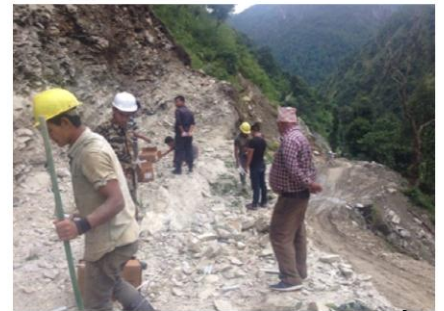
Blasting द्वारा चट्टानहरू फुटाउने तयारी गरिदै

यसमा जम्मा १३८७ वटा स्टील पाताहरू मध्ये ६०१ वटा स्टीलपाता काट्ने काम सकिएको छ । उक्त ठेकेदार कम्पनीले हाल सम्म ४८१ वटा पाइप रोल गरिसकेको छ भने ४६९ वटा पाइप वेल्डिङ्ग भइसकेको छ । साथै, २१ वटा वेल्डिङ्ग गरिएको पेनस्टक पाइपलाई विच्छाइने स्थलसम्म पुऱ्याइसकिएको छ । कार्तिकको दोस्रो हप्तादेखि पेनस्टक पाइप विच्छाइने कार्य सुरु हुने आयोजनाले लक्ष्य लिएको छ ।