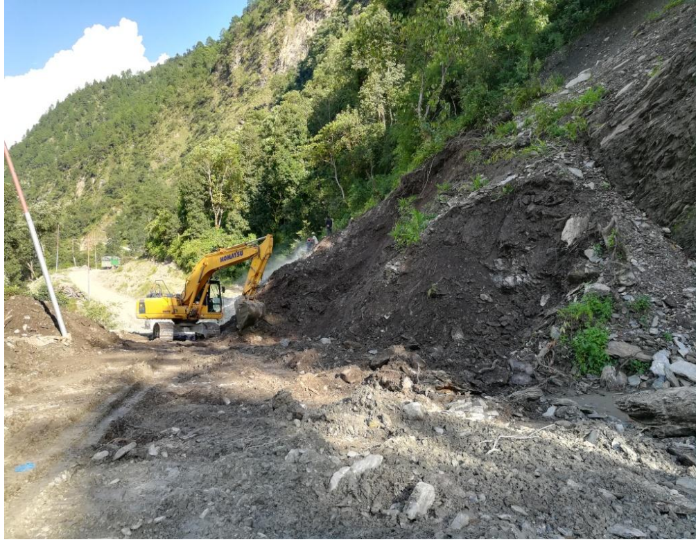
आयोजना स्थल सम्म पुग्ने पहुँचमार्ग सफा गरिदै