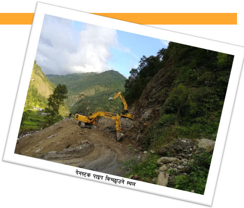
पेनस्टक पाइप विच्छाउने स्थल

यस जलविद्युत आयोजनाबाट उत्पादन हुने विद्युत १३२ के.भी प्रसारण लाइन मार्फत राष्ट्रिय प्रसारणमा जोडिने छ । उक्त १३२ के. भी. प्रसारण लाइनलाई आवश्यक जग्गा खरिद गर्ने प्रक्रिया अगाडि बढाइएको छ ।