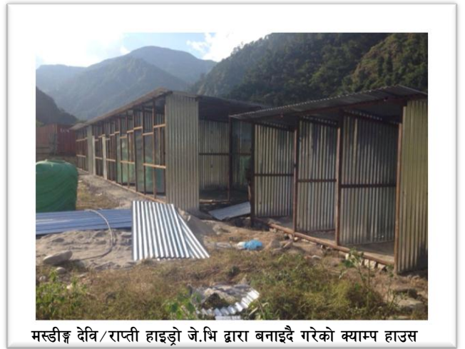
मस्डीङ्ग देवि/राप्ती हाइड्रो जे.भि द्वारा बनाइदै गरेको क्याम्प हाउस