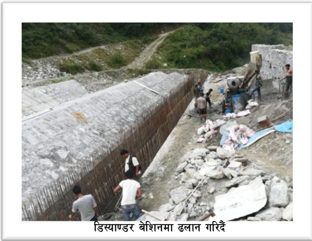
डिस्याण्डर बेशिनमा ढलान गरिदै