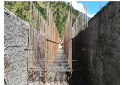
ढलानको लागि रड राखिएको