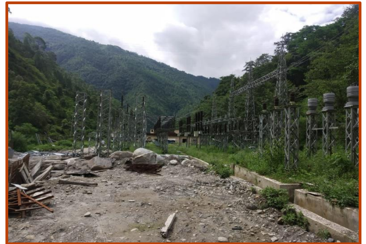
Singati Substation मा Switch yard र Bus Bar को निर्माण कार्य भईरहेको ।