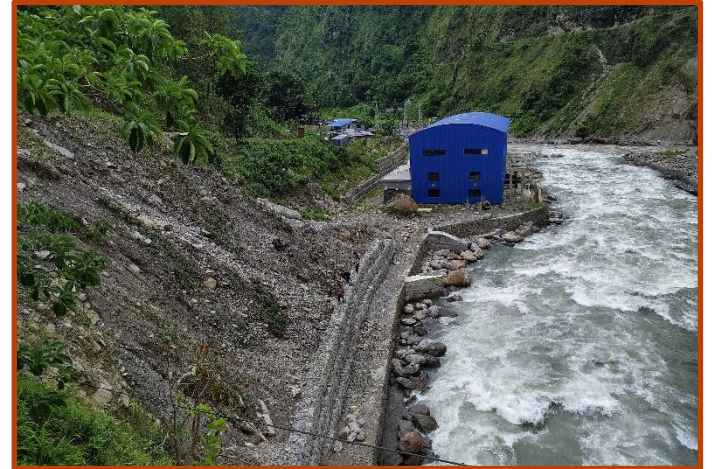
पावर हाउस with Protection

पेनस्टक पाइप तर्फको सम्पूर्ण सिभिल र हाइड्रो मेकानिकलको काम सम्पन्न भईसकेको छ र पाइप लाइन सफा गरि dry test समेत भईसकेको छ । अहिले पेनस्टक पाइप लाइनको wet testing को लागि साउन २५, २०७७ गते देखी गर्ने तयारी चलिरहेको छ ।