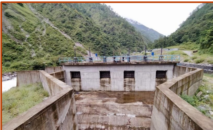
Desander को कार्य सम्पन्न भईसकेको ।

तल्लो खारे खोला जलविद्युत आयोजनाको हेडवर्क्स तर्फ सिभिल संरचनाको सम्पूर्ण निर्माण कार्य सम्पन्न भईसकेको छ र सम्पन्न भएको संरचनाहरूको testing पनि भईसकेको छ । त्यसैगरी हेडवर्क्स तर्फको हाइड्रो - मेकानिकल वर्क्स अन्तर्गतको undersluice gate, intake gate, gravel trap gate, Desander gate र Flushing gate लगायत सम्पूर्ण काम सम्पन्न गरि testing समेत भईसकेको छ ।