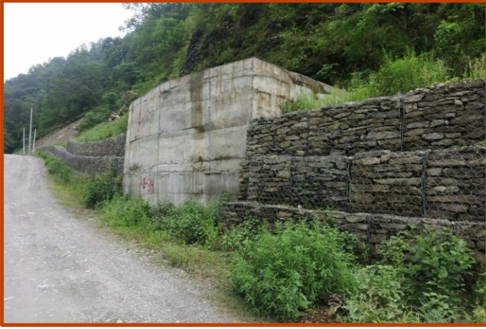
PenStock Pipeline को कार्य सम्पन्न भईसकेको ।

हाल पावर हाउसमा cabling र switch yard को boundary fencing को कार्य भईरहेको छ भने कर्मचारी भवनको निर्माण कार्यको तयारी भईरहेको छ ।