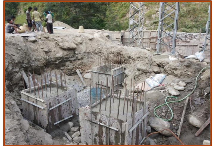
Singati Substation मा Bus Bar को foundation