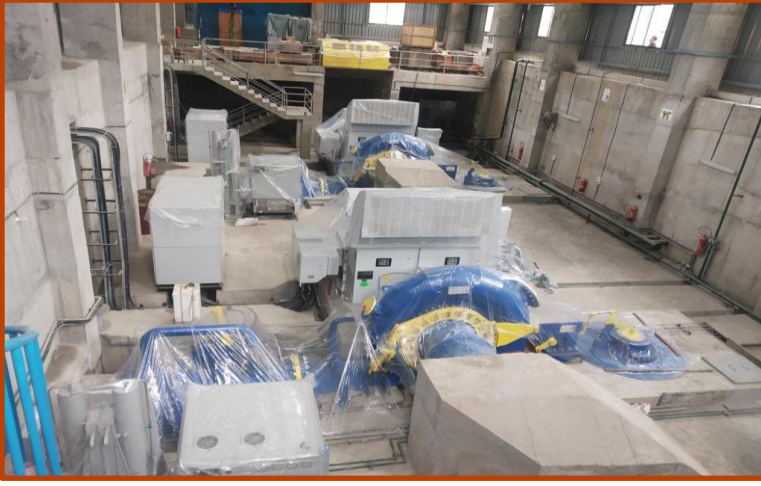
पावर हाउसको मेसिन फ्लोर ।

बाढीले क्षति भएको पावर हाउस क्षेत्रको Machine हरुको मर्मत कार्य सुरु भईसकेको छ । नयाँ खरिद गर्नु पर्ने उपकरणहरुको बारेमा पनि अध्ययन गरि चाँडै नै खरिद प्रक्रिया अगाडि बढाइने छ । क्षति ग्रस्त उपकरणहरुको बिमाको भुक्तानीको लागी बिमा कम्पनी सँग छलफल भईसकेको छ ।